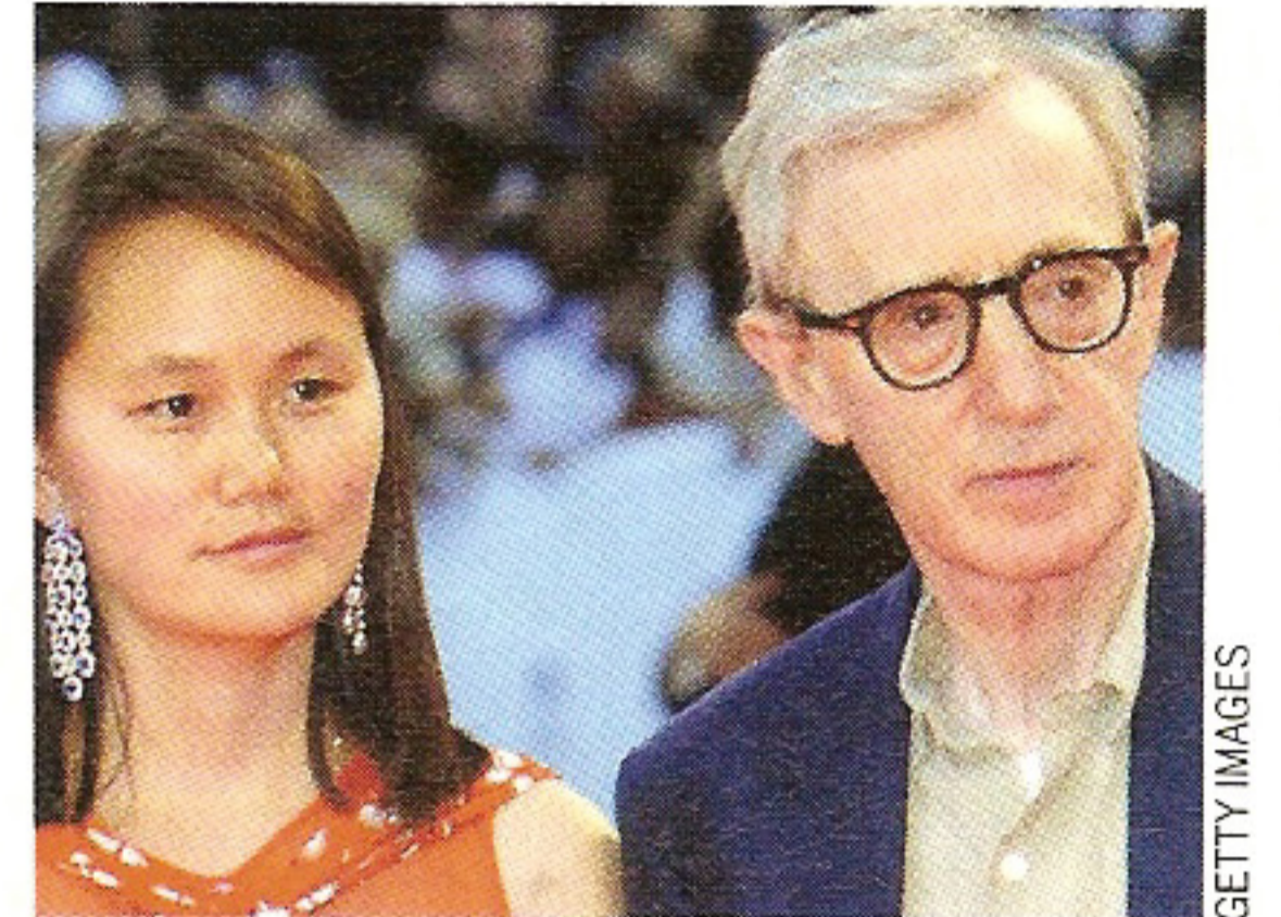
Woody Allen en Sonn Yi

mannelijke, charismatische uitstraling. Je barst van het zelfvertrouwen, uiterst sexy voor vrouwen. (Al gaat dat niet altijd op, zie Balkenende.) Dat testosterongehalte neemt toe en af, naarmate je meer of minder succes hebt en waardering krijgt. Bij Richard Krajicek hoefde je dat niet te meten, dat zag je zo wel tijdens een tenniswedstrijd. Dat was sjokken of het haantje. Er is een experiment gedaan met een apenleider.